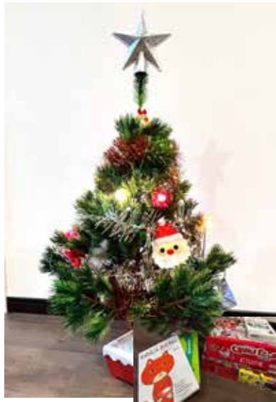
リビングにツリー登場！絵本やボードゲーム