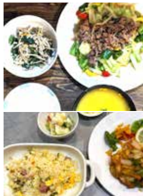
ある日の夕食（ハ▽ハ）

ホームでは月曜日から金曜日朝夕二回、スタッフが栄養バランスを考えて手づくりで準備しております。